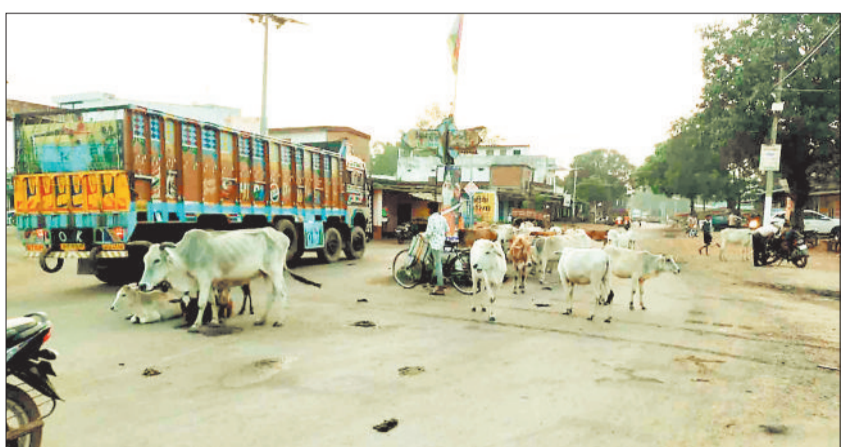
चौक पर मवेशियों का झुंड।

मानीचौक क्षेत्र में इस दिनों आवारा मवेशियों की संख्या काफी बढ़ गई है जो दिन भर जंगल व मुख्य मार्ग एवं चौक चौराहों में रहते हैं और शाम ढलते ही किसानों खेतों में पहुंच कर धान की बाली को खाकर बर्बाद कर दे रहे हैं। किसानों ने बताया कि ग्राम पोड़ी, सलका, डेडरी, सपकरा,मानी में आवारा मवेशी सैकड़ों की संख्या में क्षेत्र