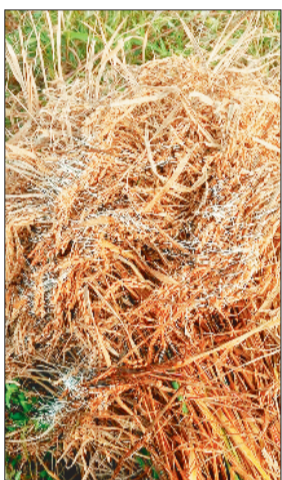
बारिश से अंकुरित हुई कटी फसल।

पकड़ा है, लेकिन जिन किसानों के द्वारा अर्ली वैरायटी का धान लगाया था वह जल्दी तैयार हो गया, ऐसे फसलों की कटाई शुरू हो गया और कटाई के दौरान ही तीन-चार दिनों तक हुई बारिश से कटे धान का उठाव नहीं हो पाया और खेतों में पड़ी रही, जिन पर बारिश की मार पड़ने से कटे धान को नुकसान