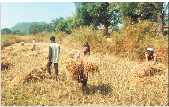
फसल को समेटने जुटे किसान।

कोरिया जिले में मौसम खुलने के बाद अब धान की कटाई जोर पकड़ने लगी है। कटाई करने के बाद धान को उठाकर खलिहान में लाया जा रहा है। अभी कटाई में तेजी नहीं आई है, लेकिन धीरे-धीरे कटाई में तेजी देखने को मिलेगा। जिले के सभी क्षेत्रों में धान की फसल पूरी तरह पक कर तैयार हो गई है, जिसे काटने में किसान परिवार जुटे। एक ओर कटाई तेज हो रही है, वहीं दूसरी ओर काटकर लाए गए धान की मिसाई का कार्य भी शुरू हो गया है।