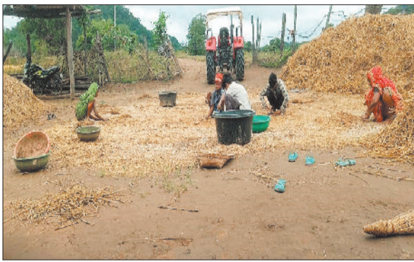
फसल को सुखाकर मिंजाई करते किसान।